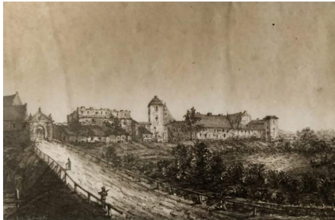
1852, Туринецька брама (не збереглася) з гравюри Здульського.

ному місці, яке і сьогодні зафіксоване вигином русло. Меліоративні канали зосереджені на південний захід від міста.