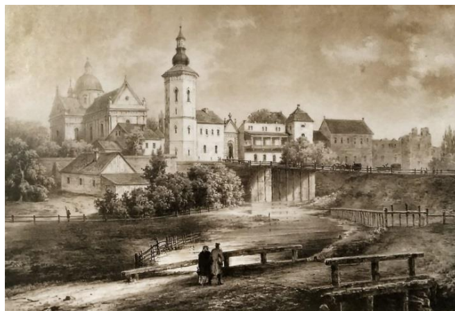
Приблизно 1879, Глинська брама з гравюри Наполеона Орди.