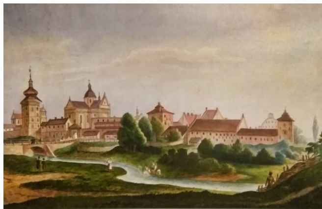
Друга половина XIX ст., акварель невідомого автора.