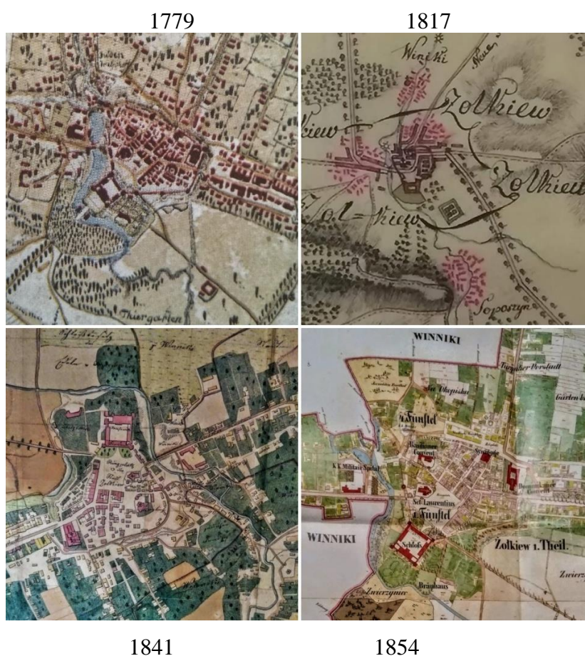
Рис. 1. Фрагменти топографічної карти і планів Жовкви 1779–1854 рр. (масштабу не дотримано, орієнтація північ-південь оригінальна) [2, 3, 6, 9]

Методи і матеріали. До дослідження ми залучили карти та плани Жовкви, починаючи від Йосифінського топознімання 1779–1882 рр. (так звана карта фон Міга, масштаб 1:28800) і закінчуючи топографічною картою радянського періоду масштабу 1:10000 1984 року: загалом вісім найбільш репрезентативних карт і планів від 1779 до 1984 року (рис. 1–2). Зауважимо, що вони різного масштабу (від 1:2880 до 1:100000) та точності знімання, та конфігурація водотоків прочитується.