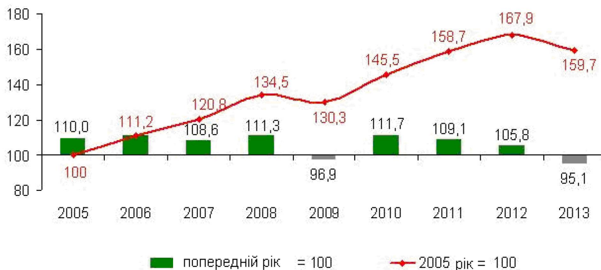
Рис. 1. Динаміка промислового виробництва в Республіці Білорусь у 2005-2013 рр., %

За підсумками 2013 р. обсяг промислового виробництва у Білорусі склав 605635 млрд. руб., тобто темпи зростання обсягів промислового виробництва склали 95,2% порівняно з попереднім роком. Зниження обсягів виробництва порівняно з 2012 р. обумовлено: в першу чергу, результатами роботи хімічної промисловості (82,2%) і нафтопереробки (77,5%), пов'язаними з погіршенням зовнішньоторговельної кон'юнктури, а також не досягненням рівня 2012 р. в целюлозно-паперовій промисловості (91%), виробництві транспортних засобів і обладнання (94,8%), металургійному виробництві (93,9%), текстильному і швейному виробництві (97,6%), виробництві шкіри, виробів із шкіри і виробництві взуття (97,7%) і машинобудуванні (97,4%), що пов'язано зі зменшенням основних ринків збуту (перш за все Росії) і посиленням конкуренції. Позитивні результати в 2013 р. були досягнуті у виробництві електрообладнання (108,1%), деревини та виробів з дерева (108,8%), неметалевих мінеральних продуктів (103,9%), гумових і пластмасових виробів (103%) і харчових продуктів (101,9%). У результаті прийнятих заходів складські запаси знижені на 5,4 трлн рублів з 1 травня 2013 р. і склали 28 трлн рублів. Співвідношення запасів і середньомісячного обсягу виробництва покращилося на 12,2%, склавши 70,2% [3].